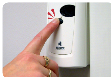
Innen ett minutt...