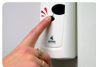
Innen ett minutt...