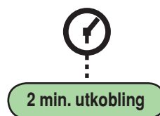
Tid for utlufting